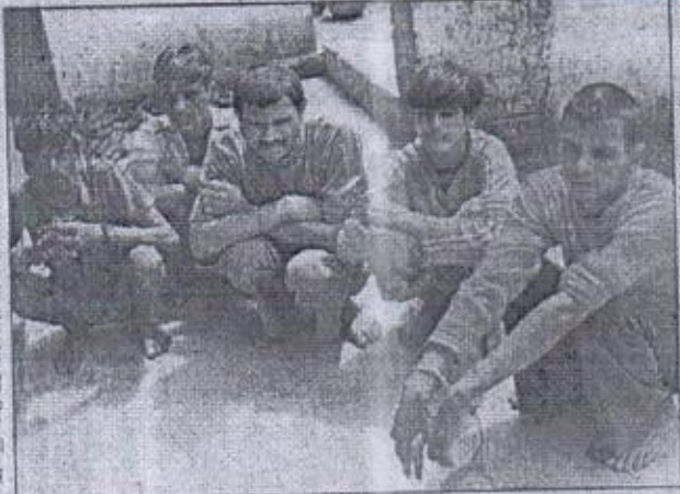
ऐसे लोग भी खेलते है जुआ

लिए रखे 52 सी रूपए व तारा के पत्ते जप्त किए गए हैं। पुलिस की यह कार्रवाई तंत्रि 8 बजे एवं 9 बजे के बीच की है।